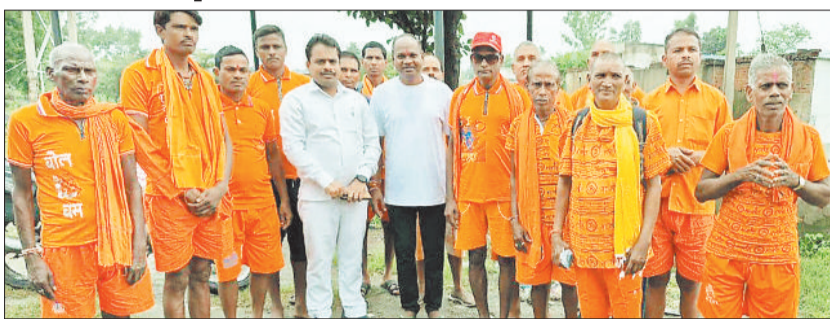
बाबा धाम के लिए कांवड़ियों का जत्था हुआ रवाना।