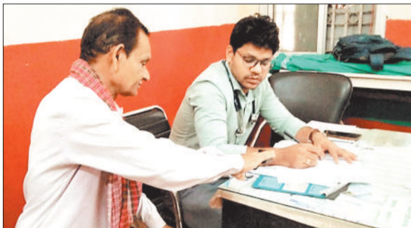
विकित्सक से इलाज कराता मरीज।