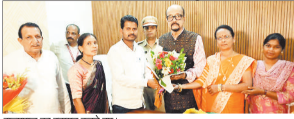
राज्यपाल का स्वागत करते हुए।