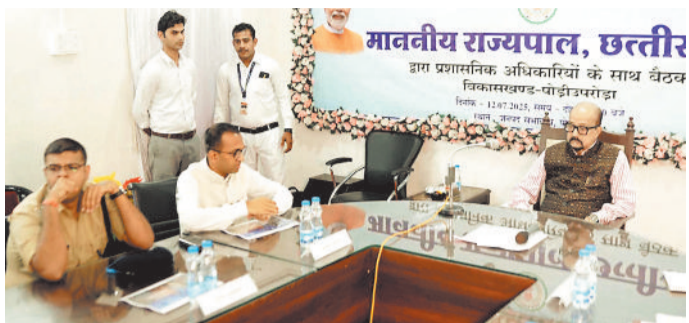
विभागीय अधिकारियों की बैठक लेते राज्यपाल श्री डेका।

सुधार करने के साथ जरूरतमंद हितग्राहियों को लाभांशित करने के निर्देश दिए। उन्होंने पौड़ी ब्लॉक में भारत नेट और पीएम आवास के कार्यों में प्रगति लाने के निर्देश देते हुए जनप्रतिनिधियों से अपील करते हुए कहा कि वे अपने क्षेत्र के विकास कार्यों को बढ़ावा देने के दिशा में कार्य करें। आकांक्षी ब्लॉक पौड़ी उपरोड़ा में अधिकारियों की बैठक लेते हुए उन्होंने ने आकांक्षी ब्लॉक के लिए निर्धारित इंडीकेटर में सेचुरेटेड के निर्देश दिए। उन्होंने स्वास्थ्य योजनाओं के संबंध में कहा कि आयुष्मान के माध्यम से टीबी हाईपर टेशन, डायबटीज के मरीजों की पहचान कर रोकथाम के लिए जागरूकता लाने के निर्देश दिए। उन्होंने अनुसूचित क्षेत्रों के बच्चों को पूरक पोषण आहार देते हुए उन्हें सुपोषित बनाने के भी निर्देश दिए। शाला त्यागी बच्चों के संबंध में उन्होंने कहा