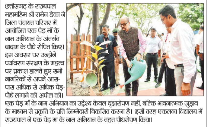
छत्तीसगढ़ के राज्यपाल महामहिम श्री रमेन डेका ने जिला पंचायत परिषद में आयोजित एक पेड़ मों के नाम अभियान के अंतर्गत बाढ़म के पीधे रोपित किए। इस अवसर पर उन्होंने पंचायत संरक्षण के महत्व पर प्रकाश डालते हुए सभी नागरिकों से अपने आस-पास अधिक से अधिक पेड़-पौधे लगाने की अपील की। एक पेड़ मों के नाम अभियान का उद्देश्य केवल वृक्षरोपण नहीं, बल्कि मानवनात्मक जुड़ाव के माध्यम से प्रकृति के प्रति जिम्मेदारी विकसित करना है। इसी तरह एकलव्य विद्यालय में राज्यपाल ने एक पेड़ के नाम अभियान के तहत पौधरोपण किया।

कि ऐसे बच्चे जो स्कूल छोड़ चुके हैं उन्हें विभाग शिक्षा से जोड़े और 60 प्रतिशत अंक लाने वाले छात्रों की संख्या को बढ़ाया जाए। जल संरक्षण व पर्यावरण संरक्षण पर उनका कहना था कि शहर और ग्रामीण क्षेत्रों में वाटर हार्नेटिंग को बढ़ावा दिया जाए। राज्यपाल ने मनरेगा के तहत निर्मित अमृत सरोवर, डबरी, तालाब में