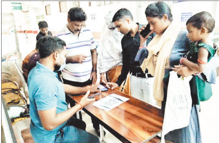
ऐप के माध्यम से रजिस्ट्रेशन कराते हुए मरीज।

उल्लेखनीय है कि स्व.बिसाहू दाम महंत मेडिकल कॉलेज जब से जिले में इसकी शुरुआत हुई है तब से यहां विशेषज्ञ चिकित्सकों सहित सारी सुविधा लोगों को मुहैया कराई जा रही है। लगातार स्वास्थ्य सुविधा में वृद्धि भी हो रही है, जो जिले के लिए खुशी की बात है। क्योंकि अब लोगों को यहां प्रारंभिक रजिस्ट्रेशन के लिए अस्पताल के दरवाजे खटखटाते नहीं पड़ते हैं और मोटी रकम भी खर्च नहीं करनी पड़ती है, बल्कि मेडिकल कॉलेज में ही आसानी से लोगों का इलाज हो जाता है। यही वजह है कि मेडिकल कॉलेज में मरीजों की संख्या दिन-ब-दिन बढ़ती जा रही है, लेकिन मरीजों की बढ़ती भीड़ की वजह से लोगों को रजिस्ट्रेशन सेंटर में लंबी लाइन लगानी पड़ती थी, क्योंकि यहां पहले