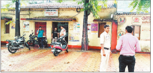
हरदीबाजार स्थित स्वास्थ्य केंद्र।