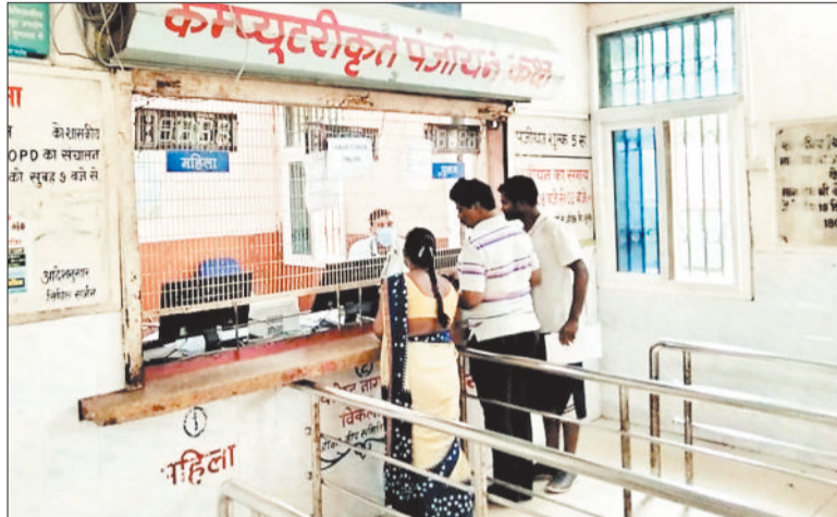
काउंटर से पर्ची लेते मरीज।